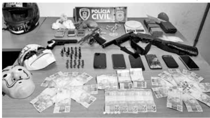
Armas, drogas e dinheiro foram apreendidos com o adolescente no Timbó