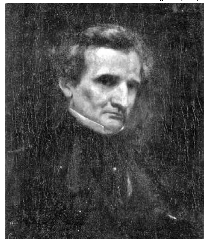
'Retrato de Hector Berlioz' (1850) feito pelo artista Gustave Courbet