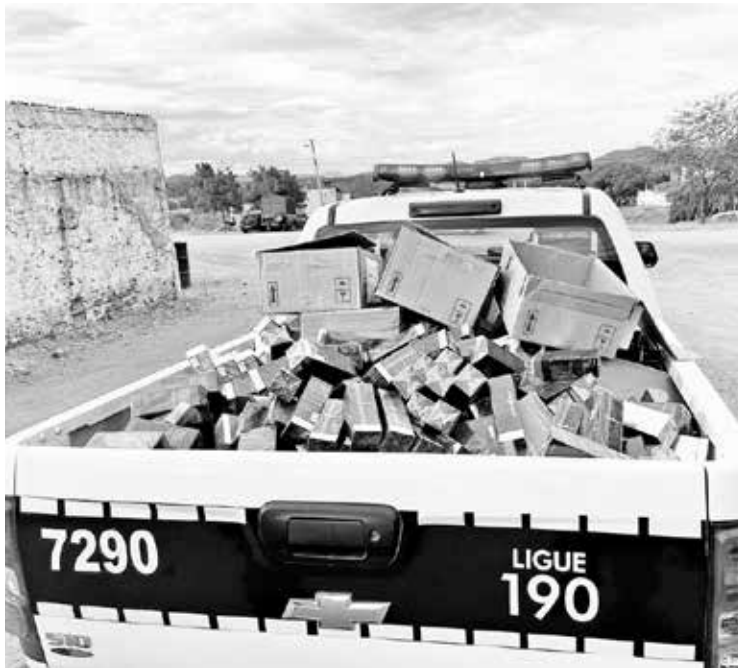
Grande parte do material roubado da loja em São Bento foi recuperada durante a abordagem da PM na rodovia federal nas imediações da cidade de Patos

Segundo a PM, na BR-230, próximo ao distrito