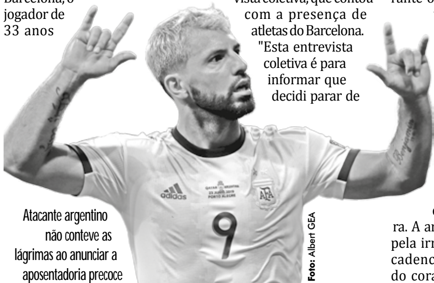
Atacante argentino não conteve as lágrimas ao anunciar a aposentadoria precoce

"Acho que fiz o meu melhor para ajudar a vencer. Estou saindo de cabeça erguida e muito feliz, não sei o que me espera, mas tenho pessoas que me amam e me desejam o melhor. Agradeço a todos".