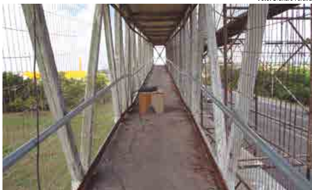
DER está realizando obras de recuperação da passarela localizada na BR-230, na Comunidade Boa Esperança