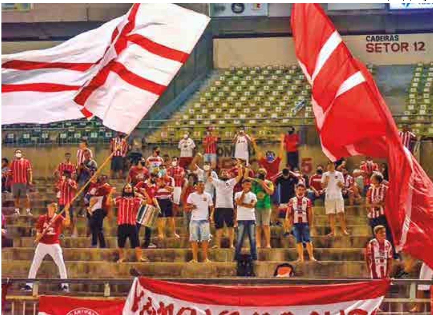
A decisão do agora ex-presidente pegou todo mundo de surpresa no clube e deixou a torcida alvirrubra preocupada com o desempenho em 2022