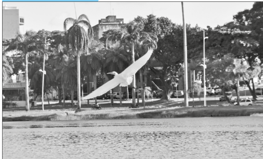
Asas da liberdade

SECRETARIA DE ESTADO DA COMUNICAÇÃO INSTITUCIONAL EMPRESA PARAIBANA DE COMUNICAÇÃO S.A.